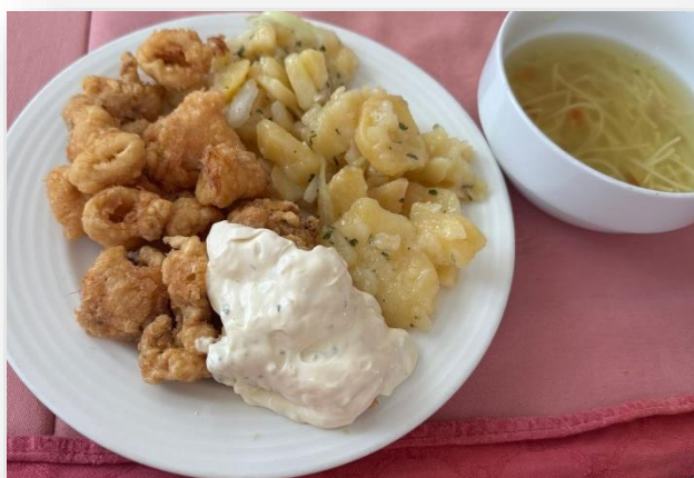
Bistra juha, lignje, krumpir salata i tartar

Predstavljamo Vam naša najukusnija jela u rujnu koja su pripremile naše vrijedne kuharice.