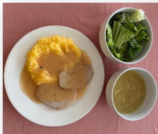
Bistra juha, kotleti na samoborski, žganci i zelena salata