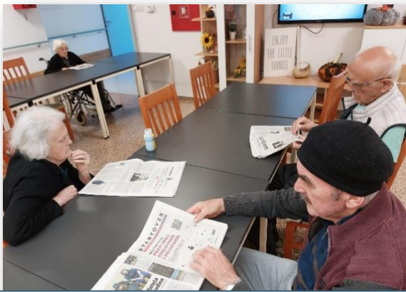
Čitali smo dnevne novine