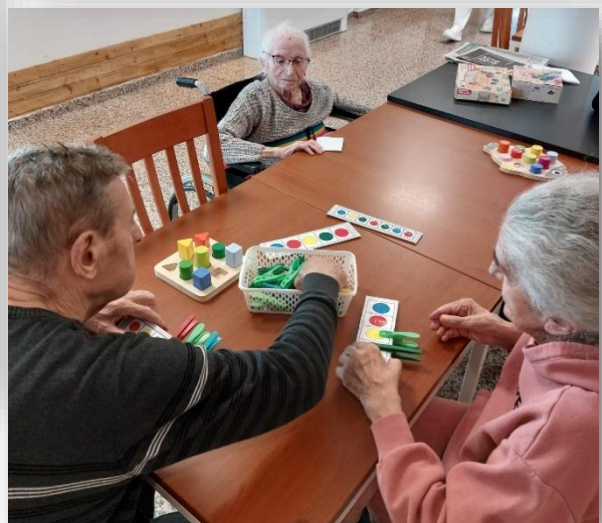
Korisnici su vježbali spretnost i preciznost uparujući kvačice s odgovarajućim bojama te slažući razne didaktičke igračke.